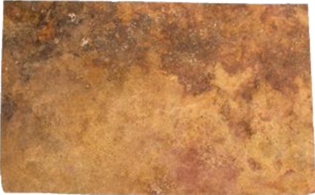
ROJO OAXACA 2