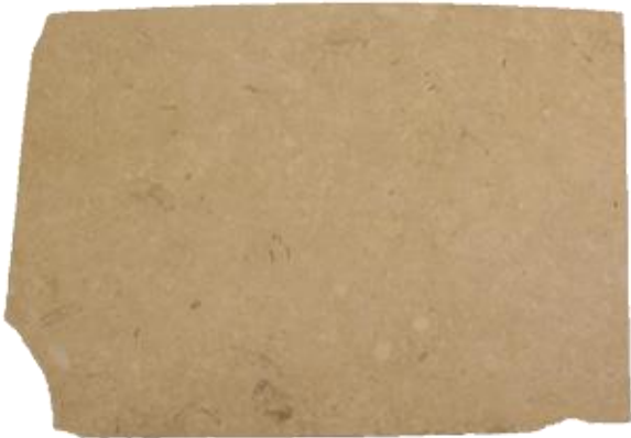
CREMA DEL DESIERTO