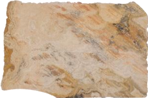
ROJO OAXACA LIGHT CLARO