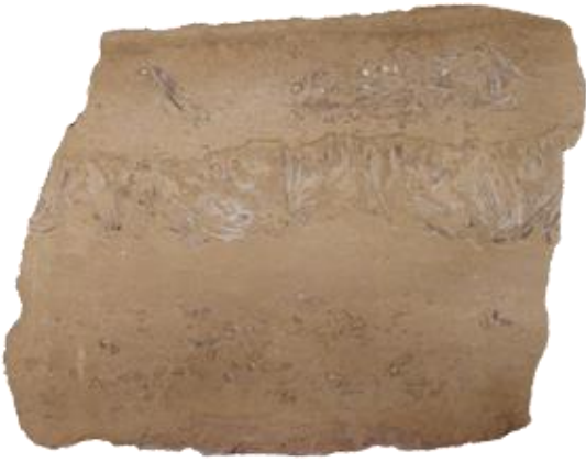
AGUA DE LUNA